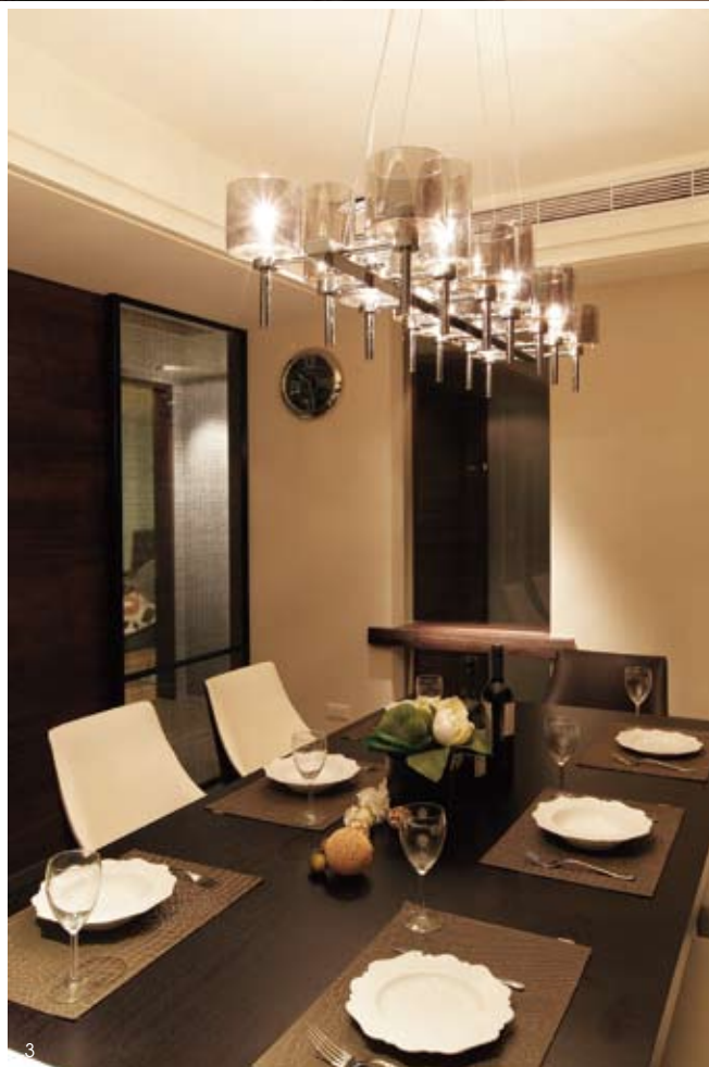
01.03.餐廳一來至餐廳，對應天花設定下的完整區塊分野，並搭配一盞極具視覺張力的主燈設計，成為空間的視覺焦點。02.餐廳門片一開放式的廚房，以大尺度的梧桐風化木門片來做客、餐廳的劃分，中間並以鏤空的方式作為把手設計，另兩側的玻璃貼上特殊的薄膜，賦予空間不同的面貌。04.書房陽台—書房也作為客房的使用，此處特地保留以南方松精心鋪排的陽台，在這裡以植栽妝點，獨享一室悠閒綠意。05.更衣室—形式開放下的機能配置，打造精品櫥窗般的生活體驗。06.主臥床頭—有著古典語彙意象的繡布造形，以細膩雅致回應空間的獨特品味。